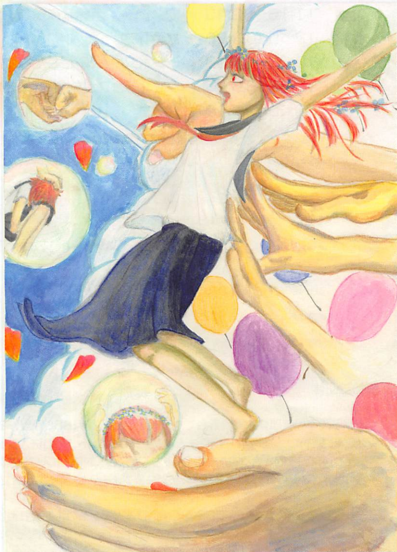
※イラストは、金沢高校美術部員による作品です。

▲JR松任駅or北鉄バス:「松任」下車徒歩数分 できるだけ公共交通機関をご利用ください。